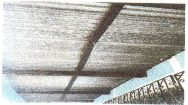
Foto2: Sustitución de estructura de soporte de madera por metal ( 3x2 pulgadas)