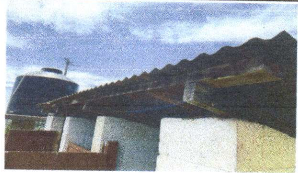
Foto 8: Sustitución estructura de soporte de madera por metal (3x2 pulgadas)