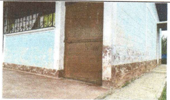
Foto 6: Mantenimiento estructura ( lijado, cambio de tubo, cepillado, sujeciones, aplicación pintura)

Observación: Si es necesario se pueden agregar hojas adicionales y actualizar el número de hojas.