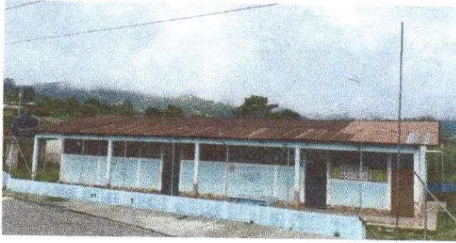
Foto1: Sustitución lamina, por lamina troquelada aluzinc calibre 26