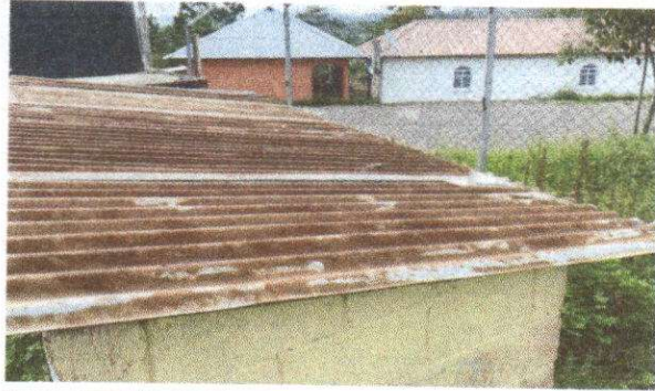
Foto 7: Sustitución lamina, por lamina troquelada aluzinc calibre 26