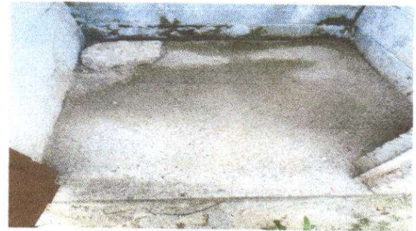
Foto 12: Sustitución de piso de torta de concreto por piso cerámico

Observación: Si es necesario se pueden agregar hojas adicionales y actualizar el número de hojas.